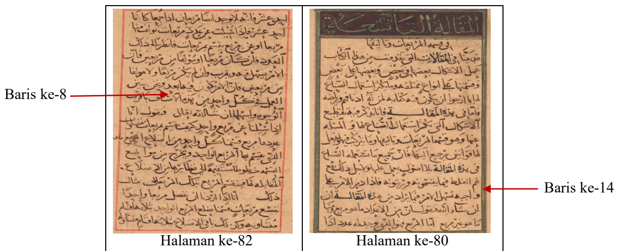
Rajah 3: Kalimah Insyallah Pada Maqalah Kesembilan

Penghasilan karya al-Hiyal menjadi bukti penyingkapan pelbagai rahsia pengetahuan ilmu geometri tersebut. Kesan kesenian pegeometrian dalam tradisi keilmuan tamadun Islam yang bertitik tolak daripada