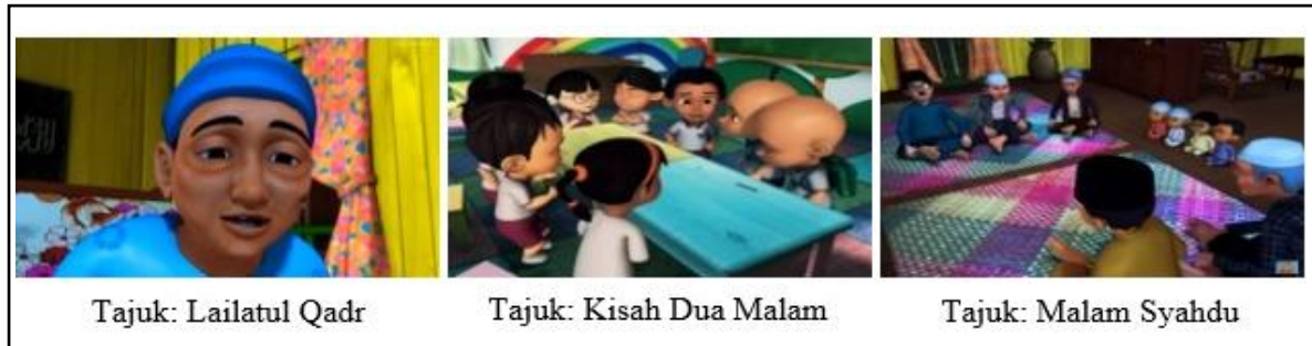
Gambar 1: Nilai Asas (Akidah)

saling kenal mengenali. Sesungguhnya yang paling mulia di antara kamu di sisi Allah ialah orang yang paling bertakwa. Allah Maha Mengetahui lagi Maha Teliti.”