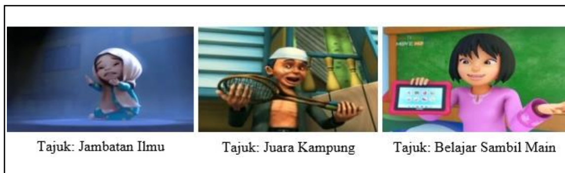
Gambar 4: Nilai tambahan atau kembangan dalam filem animasi Upin dan Ipin