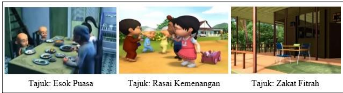
Gambar 2: Nilai Teras (Syariah)