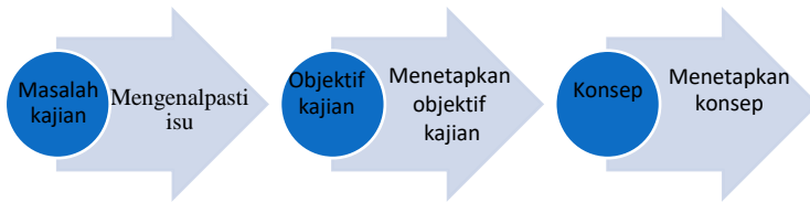
Rajah 1.0 Proses Kajian

Berdasarkan Rajah 1.0, kajian ini dimulakan dengan mengenalpasti isu. Isu sosial yang berlaku dalam masyarakat dikenalpasti sebagai masalah kajian yang perlu diselesaikan. Isu ini diperolehi berdasarkan data daripada Jabatan Perangkaan Negara, Jabatan Perdana Menteri yang dikeluarkan pada tahun 2021. Data terkini amat perlu dikemukakan, ini bagi memastikan kajian ini amat relevan untuk dilakukan dan memberi manfaat ilmu kepada pemegang taruh dan masyarakat. Setelah mengenal pasti masalah kajian, maka objektif kajian ditetapkan iaitu 1) meneliti konsep 'Ibād al-Rahmān yang terkandung dalam surah al-Furqan ; 2) mengenalpasti karakter-karakter 'Ibād al-Rahmān yang boleh dikeluarkan daripadanya. Bagi mencapai objektif kajian ini, maka konsep berdasarkan karakter yang terkandung dalam surah-Furqan perlu dianalisis dengan berpanduan kepada kajian lepas.